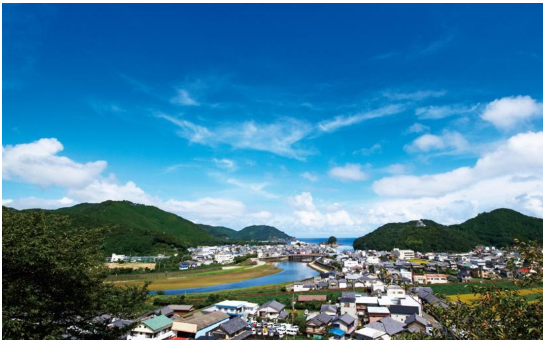
徳島県海部郡美波町の風景

当社がこのたび美波町にサテライトオフィスを開設した目的は、こうした地域社会の抱える課題に対するソリューション開発を効率的に行うことにあり、地域住民の生活基盤に溶け込みながら、今般設立されたi B e e d社 *2 のIoT基盤技術を活用した課題解決を進めるとともに、同様の課題を抱える全国の自治体、地域社会に対して展開していくための重要な拠点となるものです。